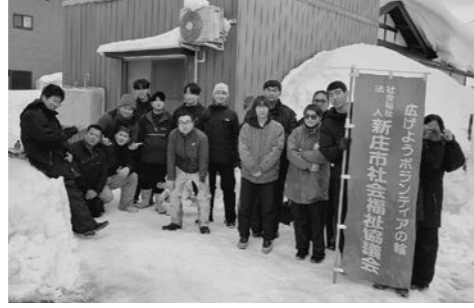
東北農林専門職大学付属農林大学校