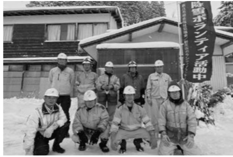
株式会社トウヨー（河北町）