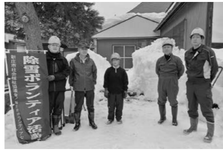
新和産業株式会社（山形市）