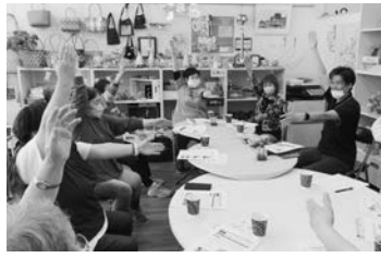
いっぶくオレンジカフェ