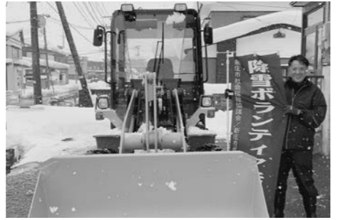
大成第一塗装工業株式会社