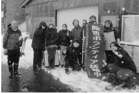
新庄コアカレッジ介護福祉科