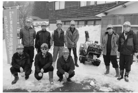
株式会社三和（山形市）