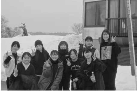
新庄市役所「お助けし隊」