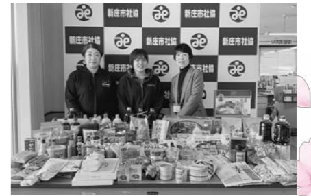
カープス マックスバリュ MORI新庄 様

皆様からお寄せいただいた善意は、地域福祉向上のために大切に活用させていただいております。