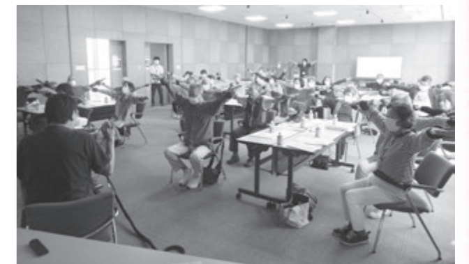
地域ふれあいサロン交流会