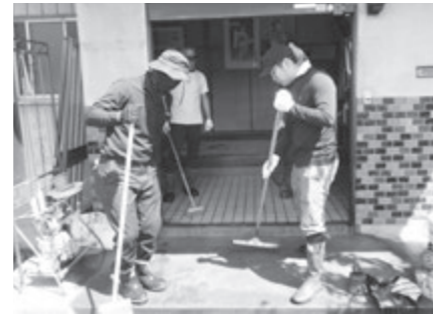
災害ボランティア活動