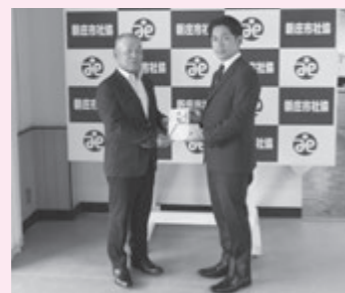
有限会社小関興業 様