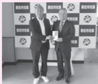
東舗工業株式会社 様