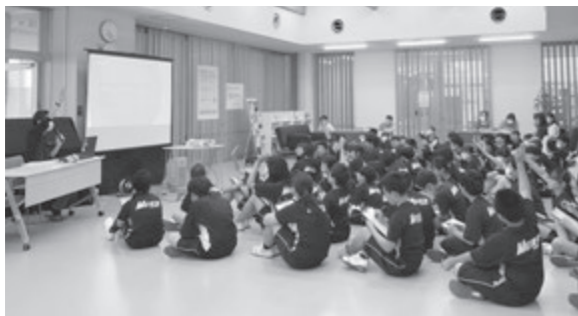
認知症キッズサポーター養成講座