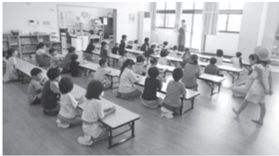
放課後児童クラブの子ども達