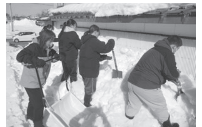
除雪ボランティア