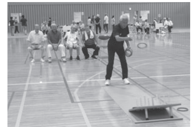
会長杯ワナゲ大会