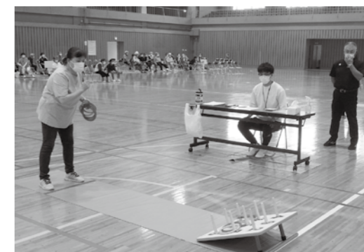
会長杯ワナゲ大会