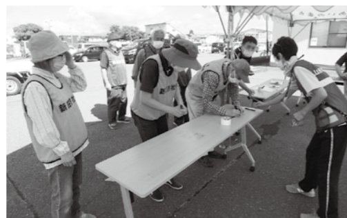
川西町災害ボランティア