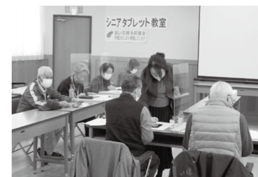
シニアタブレット教室