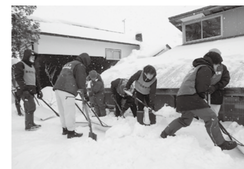
除雪ボランティア