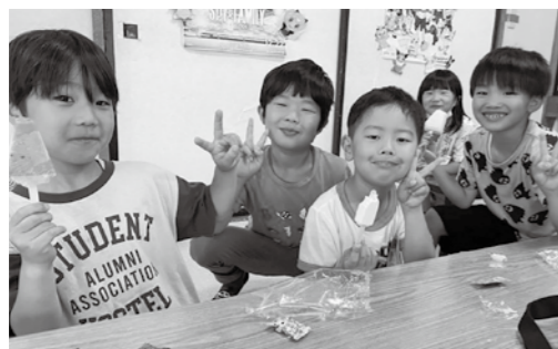
放課後児童クラブの子ども達