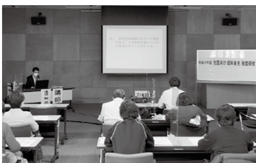
市民向け成年後見制度研修会