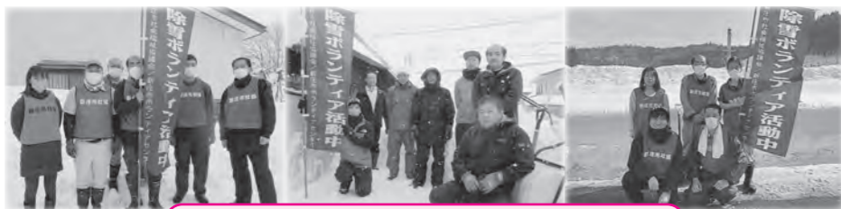
新庄市役所「お助けし隊」&個人ボランティア3名