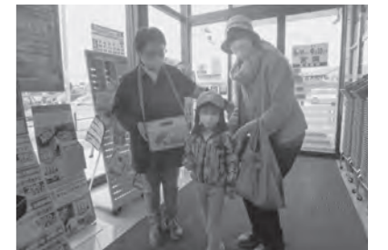
あじさいウォーキング