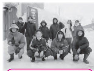
新庄中学校JRC委員会