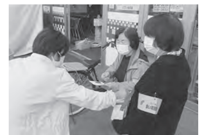
身体障害者福祉協会