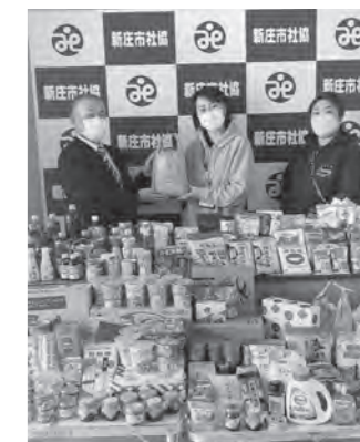
カーブスマックスバリュ MORI新庄 様