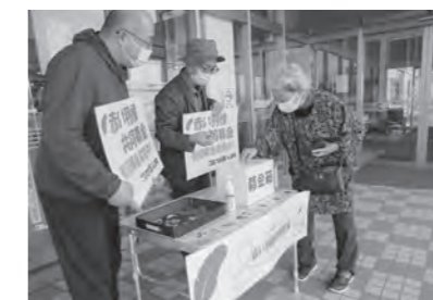
社会福祉士会最上支部