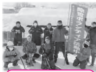
郵便局長会最上北部会