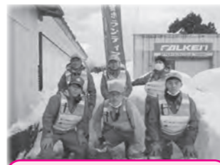
東北電力ネットワーク(株)新庄電力センター