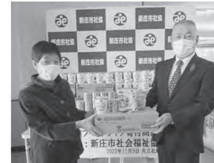
共立社新庄生協 様