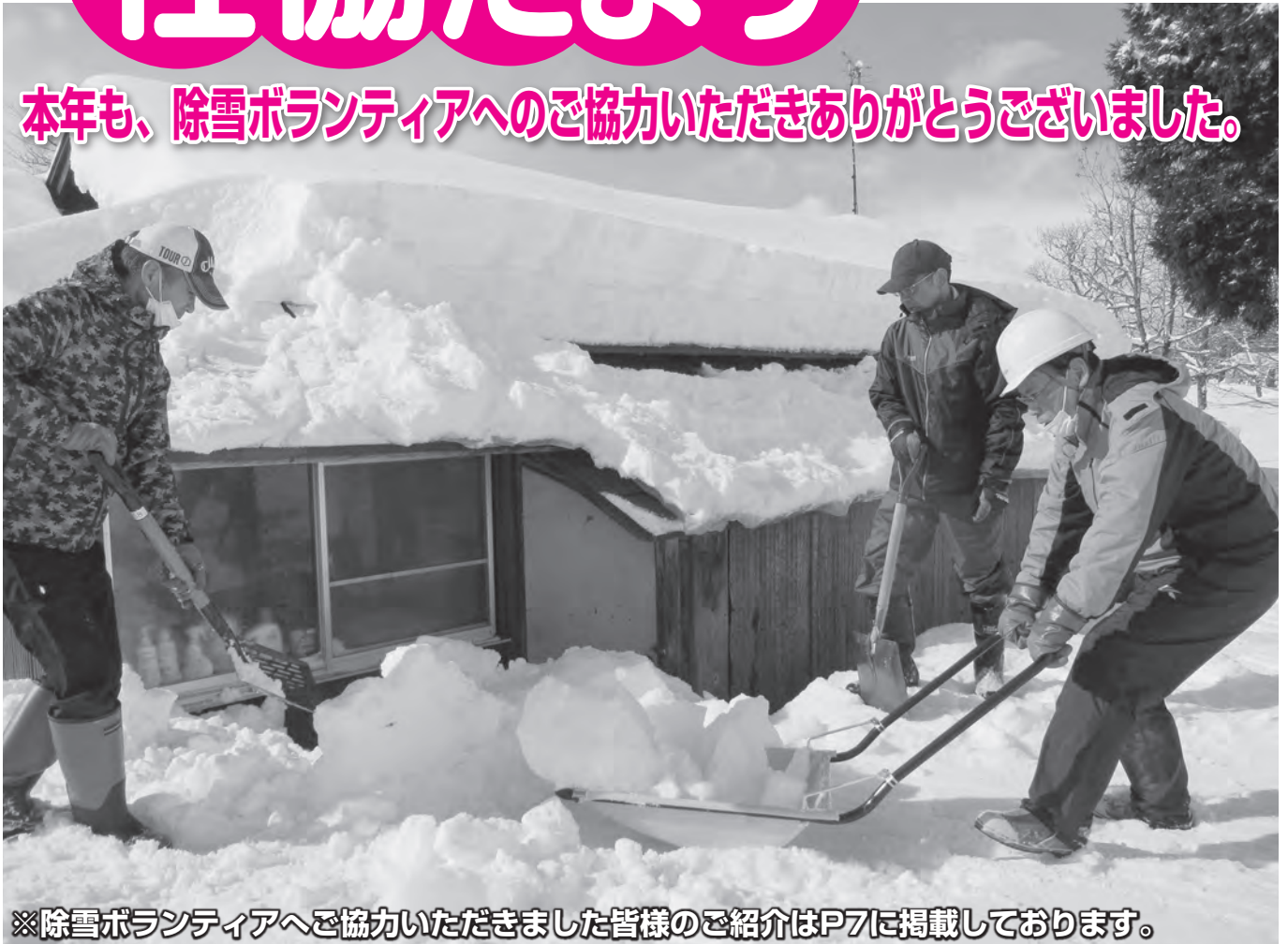
※除雪ボランティアへご協力いただきました皆様のご紹介はP7に掲載しております。