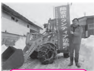
大成第一塗装工業(株)