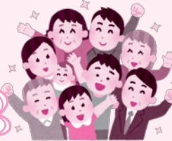
わからないところは互いに教え合いながら