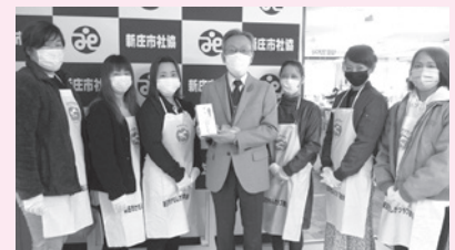
新庄市かもしかクラブ連合会 様

皆様から頂いた善意は、地域福祉の向上のために大切に活用させていただいております。