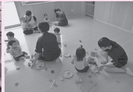
明倫中学校の夏休みボランティア