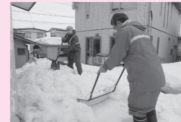
除雪ボランティア