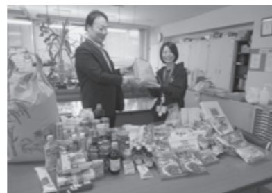
カーブスマックスパリュ MORI新庄 様