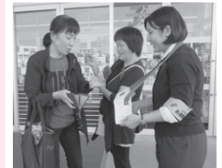
新庄市交通安全母の会