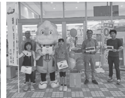
山形県社会福祉士会最上支部