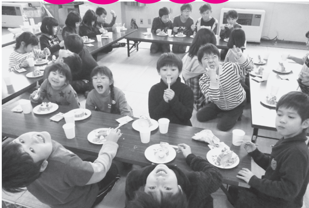
クリスマス会にぎわう北辰学童保育所の子どもたち