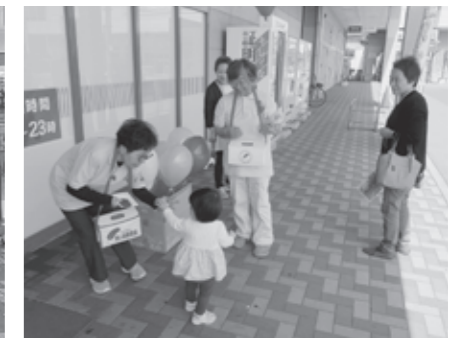
新庄市更生保護女性会