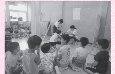
学童保育ボランティア