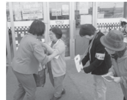
新庄市身体障害者福祉協会