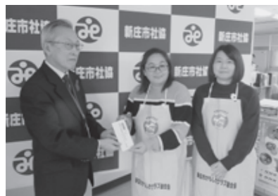
新庄かもしかクラブ連合会 様

皆様から頂いた善意は、地域におけるボランティア活動推進など地域福祉の向上のために大切に活用させていただいております。