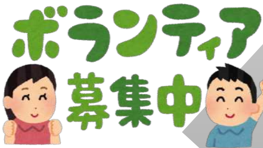
広報活動のための器材