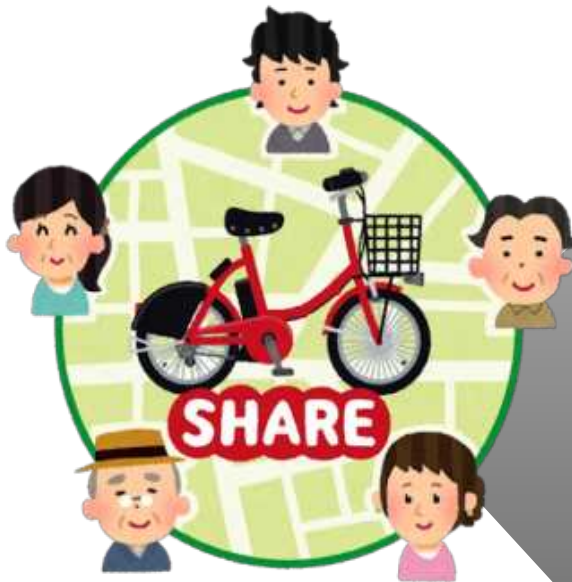
施設や他団体と共有する器材