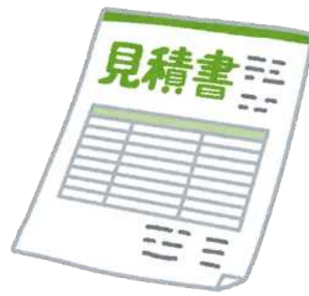
見積書 (相見積もり)