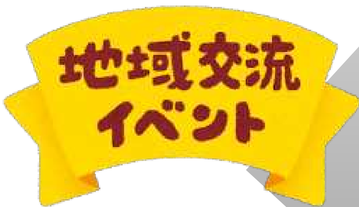
イベント開催費用