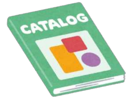
パンフレットカタログ