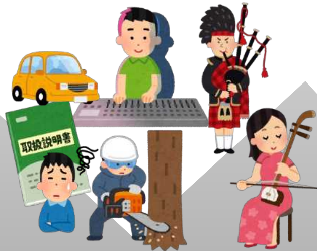
使用できる人が限定される器材・楽器等