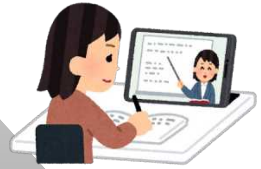
ボランティア研修・資格取得のための器材 * 手話通訳者養成のための器材は除く。