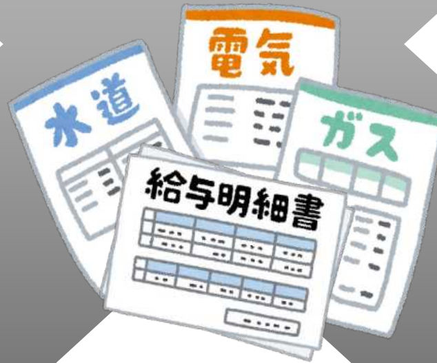
一般管理事務を行うための器材